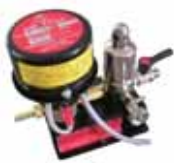
オートエアートラップ P1-2HE (AC200V)

■ タンクドレンを抜いてPSD8型に送り込むには下記のトラップをご用意ください。