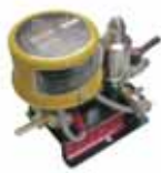
電子トラップ UP155-2E (AC200V)

タンク内のドレンをモーターが起動する度ごとにPSD8型内にドレンを送り込み清水にします。