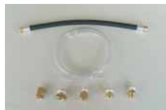
タンクとトラップを接続する 標準取付部品

タンク内のドレンを15分間毎に5秒間(可変)PSD8型内にドレンを送り込み清水にします。